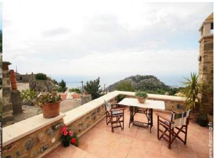
vue depuis la terrasse sur toit