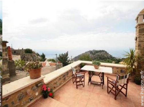
vue depuis la terrasse sur toit