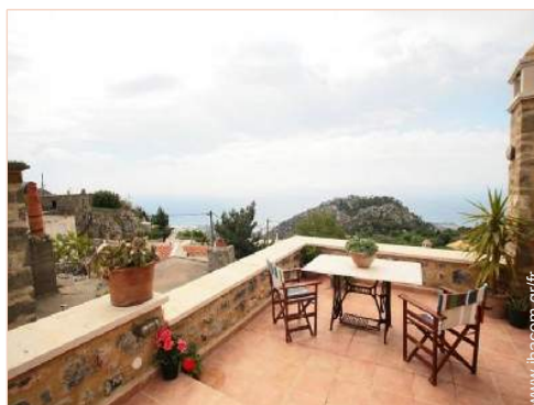
vue depuis la terrasse sur toit