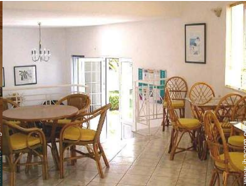
Agencement intérieur à disposition des hôtes