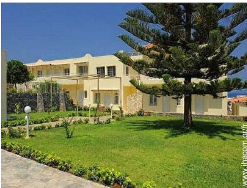
Installation extérieure à disposition des hôtes