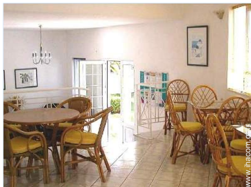
Agencement intérieur à disposition des hôtes