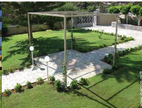
Installation extérieure à disposition des hôtes