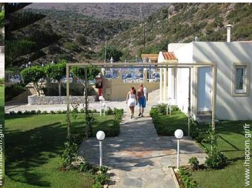
Installation extérieure à disposition des hôtes